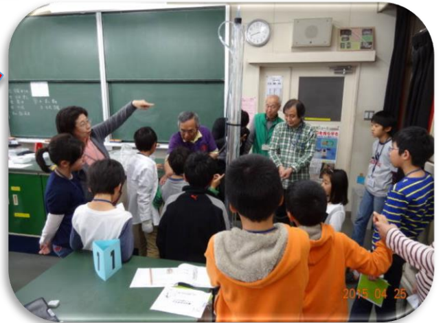
(「ヘロンの噴水」の科学体験塾風景)

あなたの経験を次世代に伝えたいとお考えの方 社会貢献活動・地域貢献活動を目指す方 子どもが好きならどなたでもできます。