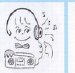
紙コップヘッドフォン