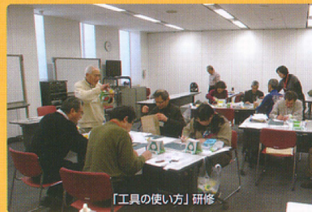
「工具の使い方」研修