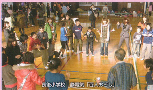
長後小学校 静電気「百人おどし」

小学校の課外授業等への協力や地域イベントへの参加など地域との連携に努めています。