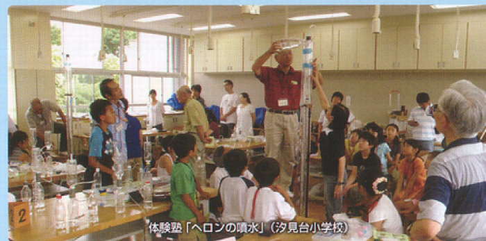
体験塾「ヘロンの噴水」(汐見台小学校)