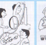
ジェットコースター