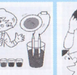
水と色の ファンタジー